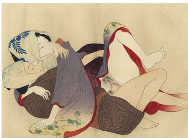
Mizuno Toshikata, vers 1900, 17,5 cm x 12 cm

Prenons le cas du Japon, par exemple, l'ouverture de celui-ci au monde Occidental dans le 19e siècle révèle le commerce d'estampes représentant des figures et des scènes de nus et d'actes sexuels, souvent à caractère explicite n'étant pas cependant considéré comme une mise en scène de « mauvais moeurs », mais plutôt comme des scènes dévoilant le quotidien et l'intimité des êtres, commercialisées sans le poids du jugement moral, sans le souci de l'atteinte de la pudeur. Ceci étant renforcé par la mise en avant des organes génitaux représentés hyperboliquement grands, mais sans aucune intention relevant de la « perversité ».