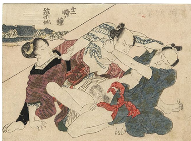
École de Utagawa, vers 1850, 13cm x 9, 2 cm