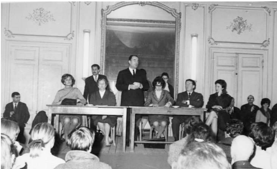
Réunion publique avec François Mitterrand et Yvette Roudy à Nevers en 1966, photographie noir et blanc, anonyme, Angers, CAF, © Yvette Roudy.